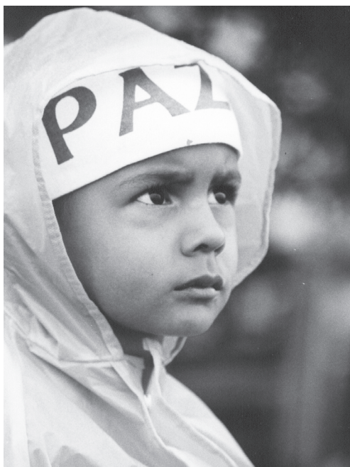
Manifestação pela paz.