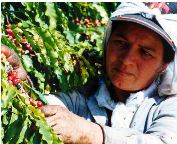
Mulher migrante do norte do Paraná em colheita de café no interior de São Paulo.