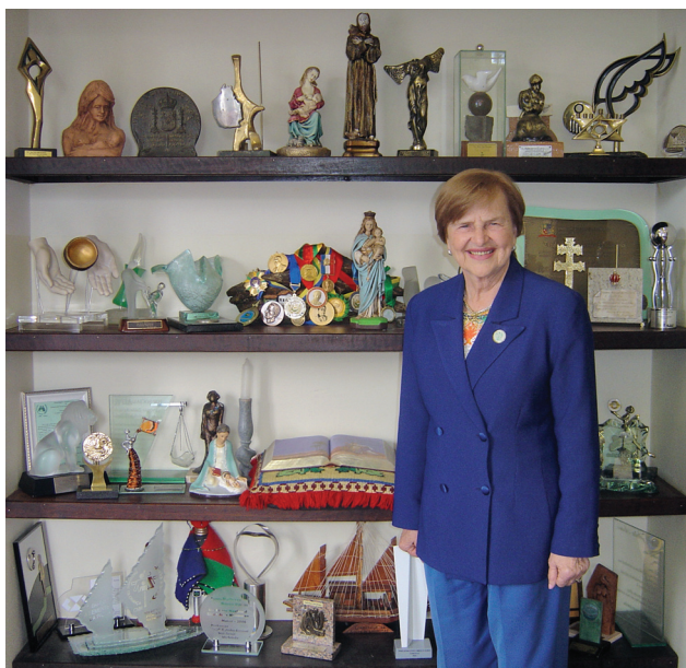
Zilda Arns Neumann.