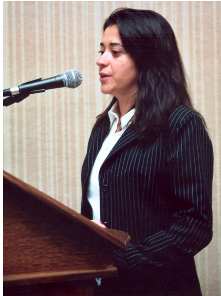
Representante da Fundação Gol de Letra na entrega do V Prêmio USP de Direitos Humanos.