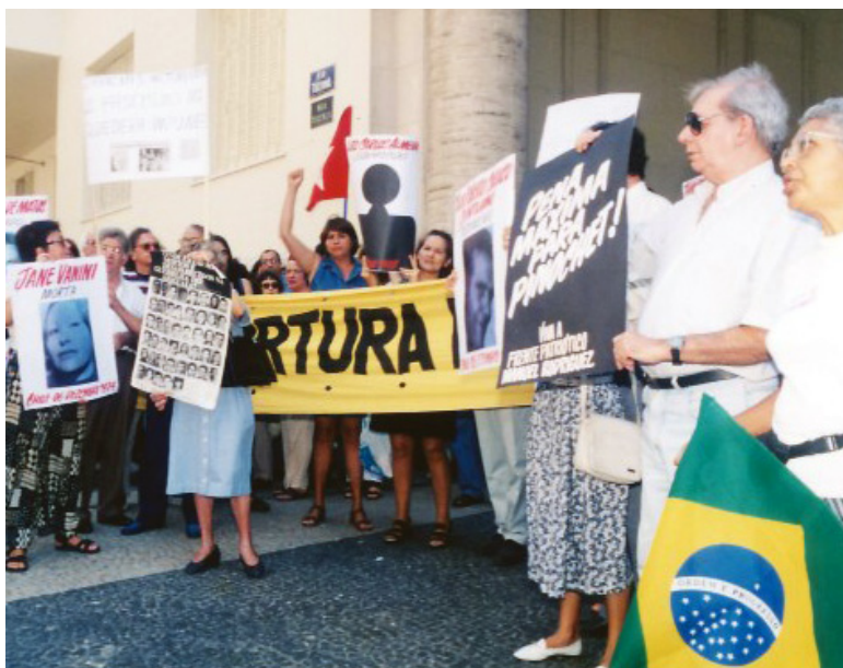
Manifestação contra tortura.