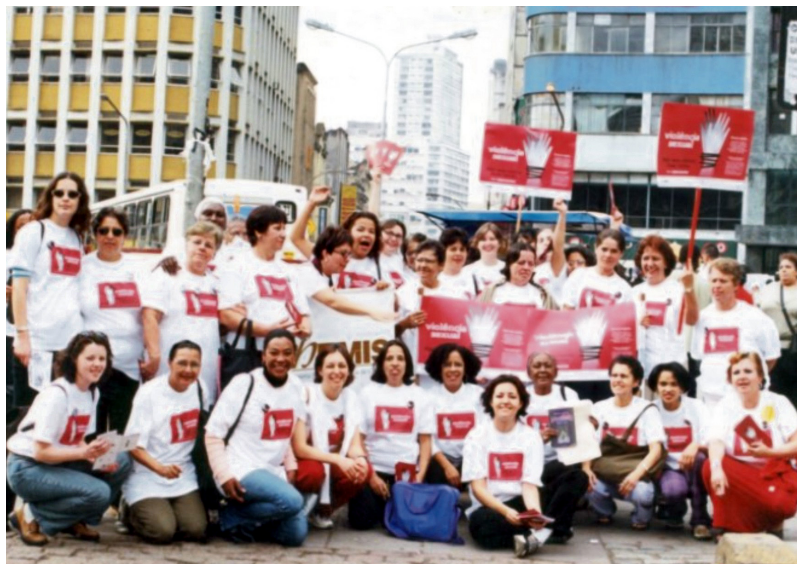
Grupo atuante em defesa dos direitos das mulheres.