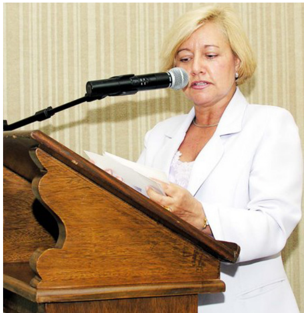
Reitora da Universidade de São Paulo.