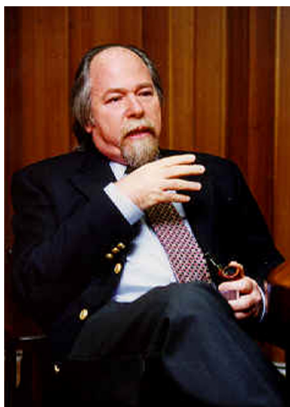
Reitor da USP entre 1997-2001.