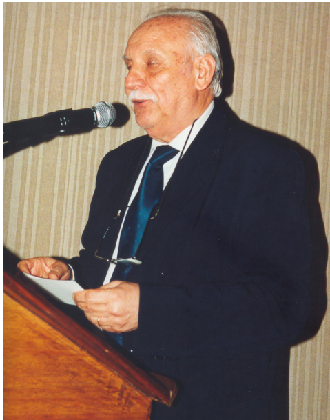
Reitor da USP entre 2001-2005.