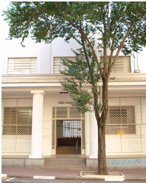
Centro Universitário Maria Antonia, Sede da Comissão de Direitos Humanos da USP.