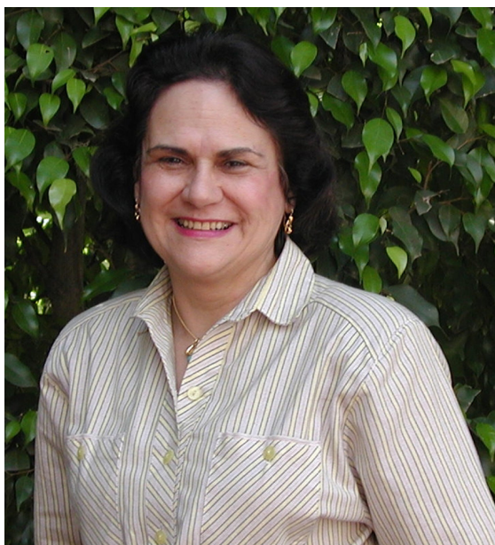
Presidente da Comissão de Direitos Humanos da USP.